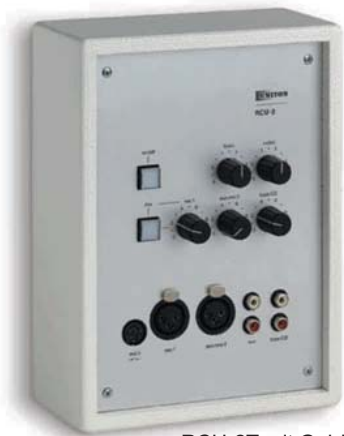
RCU-2T mit Gehäuse RCU2-GAP